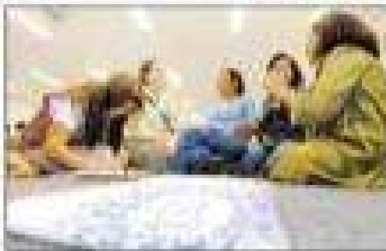
Il sistema, nato nel 1995, è un programma di cooperazione tra le università italiane e le università americane, che ha lo scopo di promuovere la ricerca scientifica e la formazione di ricercatori. Il progetto è finanziato dalla National Science Foundation e dalla European Union. A seguito dell'adesione al programma, le università italiane hanno ottenuto una serie di vantaggi, tra cui la possibilità di partecipare a progetti di ricerca congiunti, di inviare ricercatori e studenti in visita, e di ricevere finanziamenti per la ricerca.